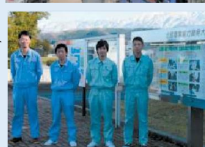
(2019年版ものづくり白書)