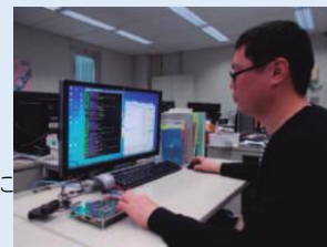
(2018年版ものづくり白書)