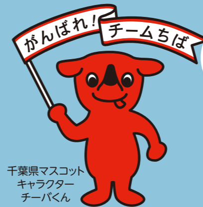
千葉県マスコット キャラクター チーバくん