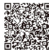
企業における 家庭教育支援講座

連絡先 千葉県教育庁教育振興部生涯学習課 学校・家庭・地域連携室 [TEL] 043-223-4167 [FAX] 043-222-3565 [メール] kysho2@mz.pref.chiba.lg.jp