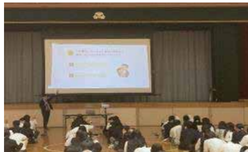
SMBCコンシューマーファイナンス株式会社 出前授業

お金に関する知識と判断力の習得を目的としたセミナーです。ライフプランニング・資産形成や、金融トラブルの対策方法などをクイズやワークを交えてセミナーを行っています。