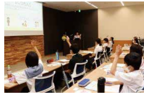
株式会社千葉銀行 キャリア教育しごと体験スクールの様子

「お金の仕組み」「銀行の役割」についてのレクチャー、名刺交換や電話対応の練習など、ゲームを交えながら楽しく学べるプログラムを行っています。