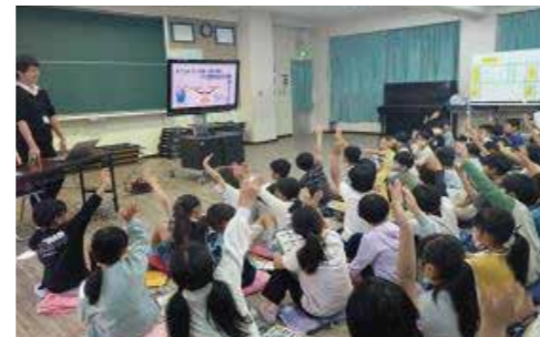
株式会社パル・ミート 出前授業

お金に関する知識と判断力の習得を目的としたセミナーです。ライフプランニング・資産形成や、金融トラブルの対策方法などをクイズやワークを交えてセミナーを行っています。