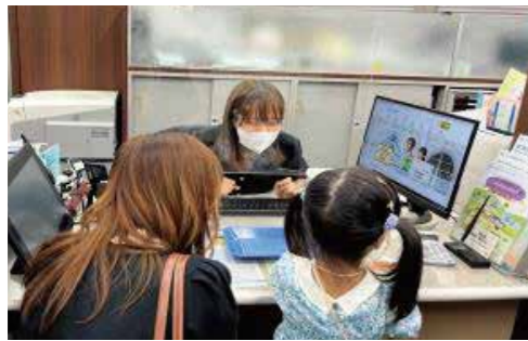
三井住友信託銀行株式会社 船橋支店

職員の家族向けに「子ども参観」を開催し、名刺交換、模擬紙幣での札勘定、窓口体験等を通じて、銀行の仕事に興味をもって学ぶ機会を設けています。