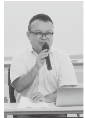
清田弁護士による講演