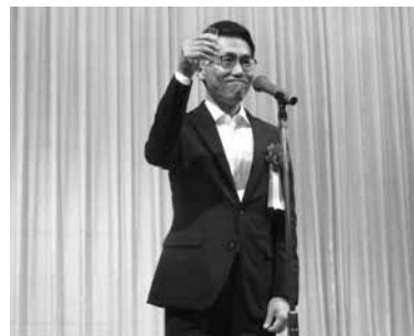
寺西商工中金千葉支店長の乾杯