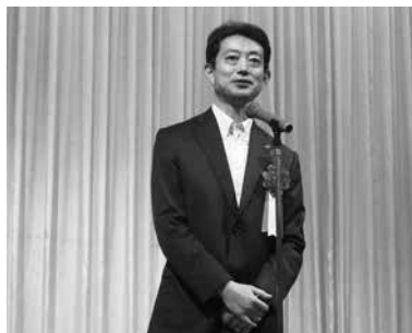
熊谷県知事の挨拶

総会終了後の懇親会では、熊谷俊人千葉県知事、阿部紘一自由民主党千葉県支部連合会幹事長の挨拶をいただいた後、寺西英明商工中金千葉支店長の乾杯のご発声により盛大に開催され、和やかな雰囲気の中、参加者一同による交流や懇談が活発に行われた。