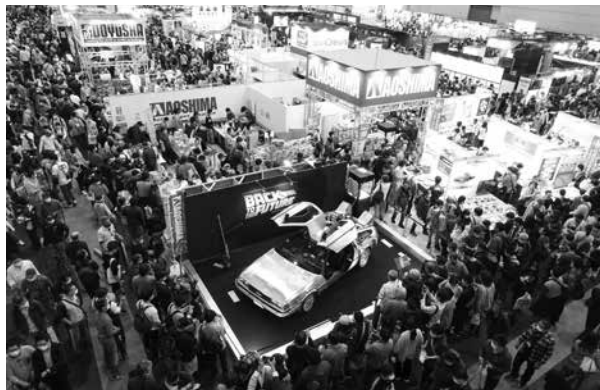
静岡ホビーショーの様子（アオシマブース）

「静岡ホビーショー」を、日本が誇る模型ブランドが一堂に会してトレンドとなる新製品を発表する日本最大級の模型の見本市に成長させ、同時開催の「モデラーズクラブ合同作品展」には国内外から多くのクラブが出展するなど、「ホビーのまち静岡」としてブランドが構築されたことにより、組合員が享受した事業効果は非常に大きい。