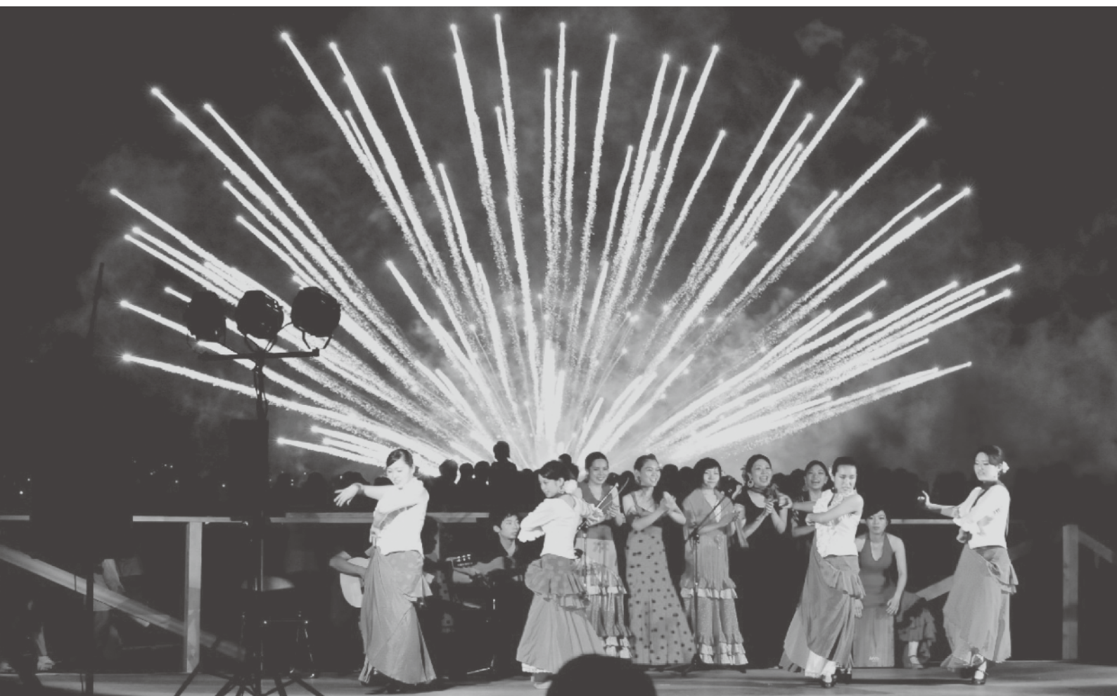
表紙写真（館山・花火とフラメンコ）