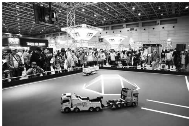
静岡ホビーショーの様子（タミヤブース）