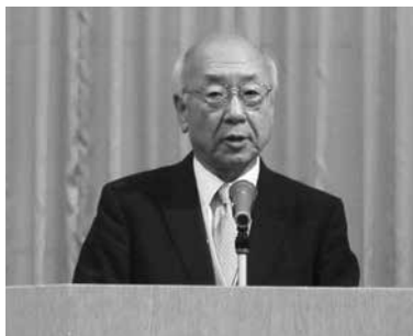
日暮副会長の開会挨拶